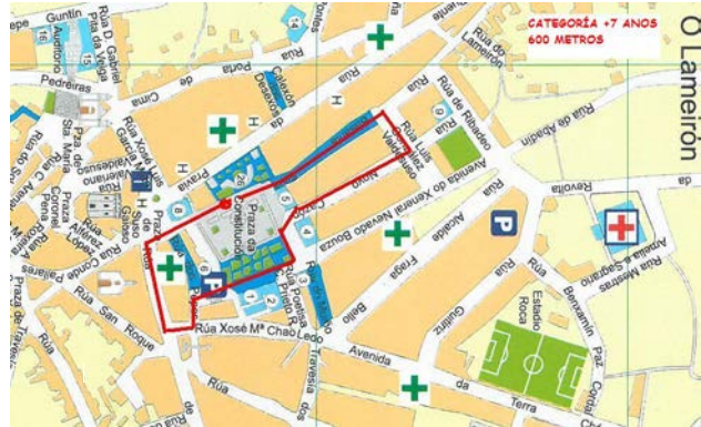
Categoría + 7 anos