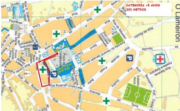
Categoría + 5 anos