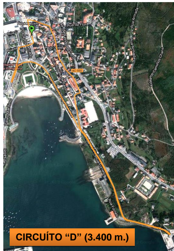
CIRCUÍTO "D" (3.400 m.)

DESCRIPCIÓN: completar 1 volta ao "CIRCUITO C" + 1 volta ao "CIRCUITO D". Saída diante da Casa do Concello, Rúa Domingo Antonio de Andrade, Rúa Alvarellos Berrocal, Rúa de Arriba, Rúa Magdalena, Rúa Campo do Sacramento, Rúa da Mariña, Rúa do Paseo do Alcalde D. Pepe Sánchez, Hospital Virxe da Xunqueira, Casa da Cultura, Rúa Europa, Rúa Domingo Antonio de Andrade, Rúa Alvarellos Berrocal, Rúa de Arriba, Rúa Magdalena, Rúa Campo do Sacramento, Rúa da Mariña, Rúa Fornelo, Porto de Brens, Rúa Fornelo, Rúa da Mariña, Rúa do Paseo do Alcalde D. Pepe Sánchez, Hospital Virxe da Xunqueira, Casa da Cultura, Rúa Europa e Rúa Domingo Antonio de Andrade.