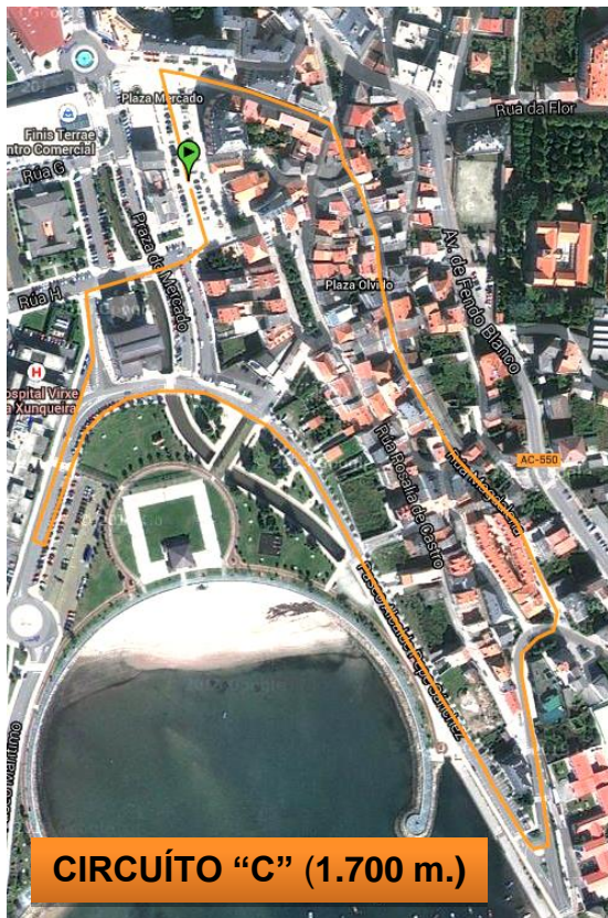
CIRCUÍTO "C" (1.700 m.)